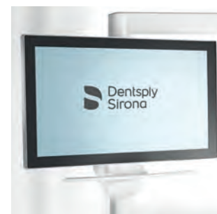
22-дюймовый монитор Sivation на опорной стойке или лотке