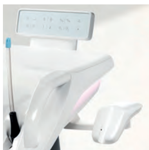
Лоток для хранения полимеризационной лампы SmartLite Pro