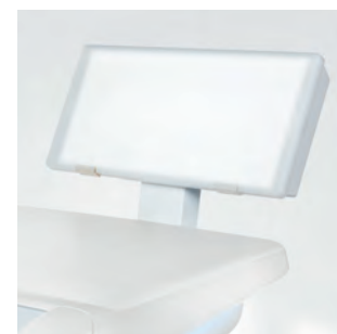
Панорамный рентгеновский аппарат