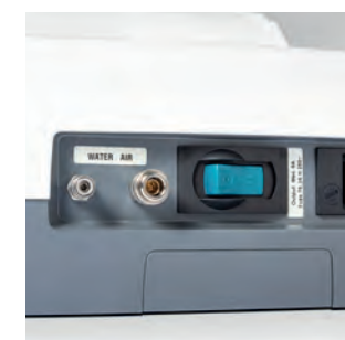
Комплект клапанов для внешних устройств