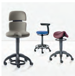
Рабочие стулья Hugo, Theo, Carl