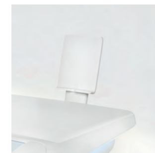
Держатель интеллектуальных устройств для планшета