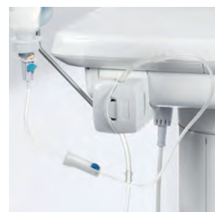
Встроенный насос для физиологического раствора