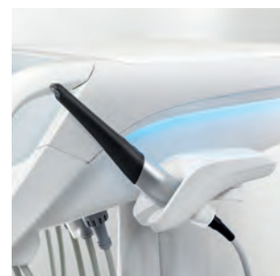
SiroCam AF+ в дополнительном держателе