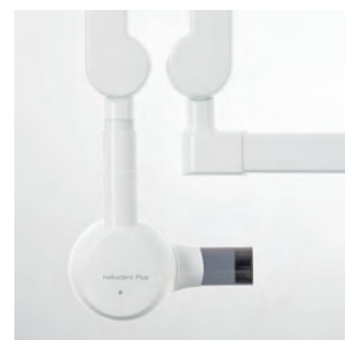
Блочная модель Heliodent Plus