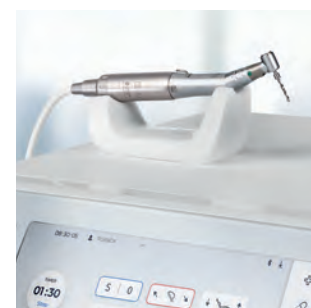
Электродвигатель BL Implant E (с подсветкой)